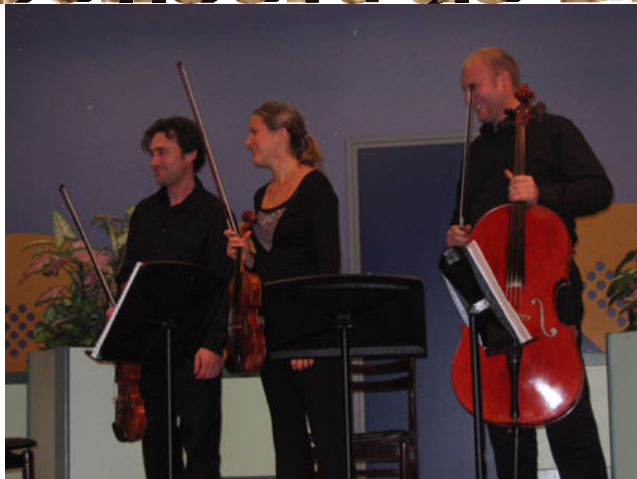
Ce soir-là l'ensemble Sirius jouait en formation trio