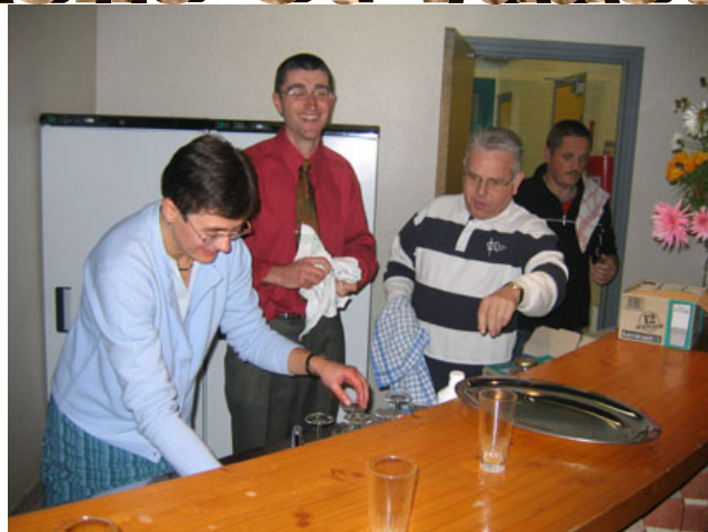
Après le concert la bonne humeur règne