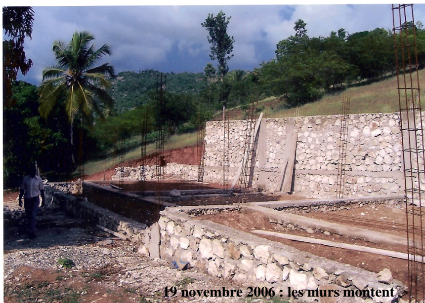
19 novembre 2006 : les murs montent

La construction avance, au fur et à mesure de nos moyens, et nous espérons que 2007 verra la fin des travaux et l'ouverture de l'école que les enfants attendent impatiemment.