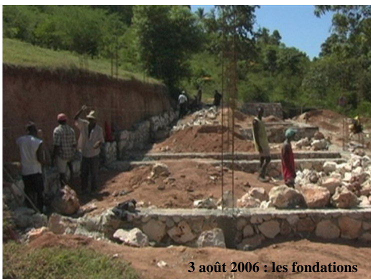
3 août 2006 : les fondations